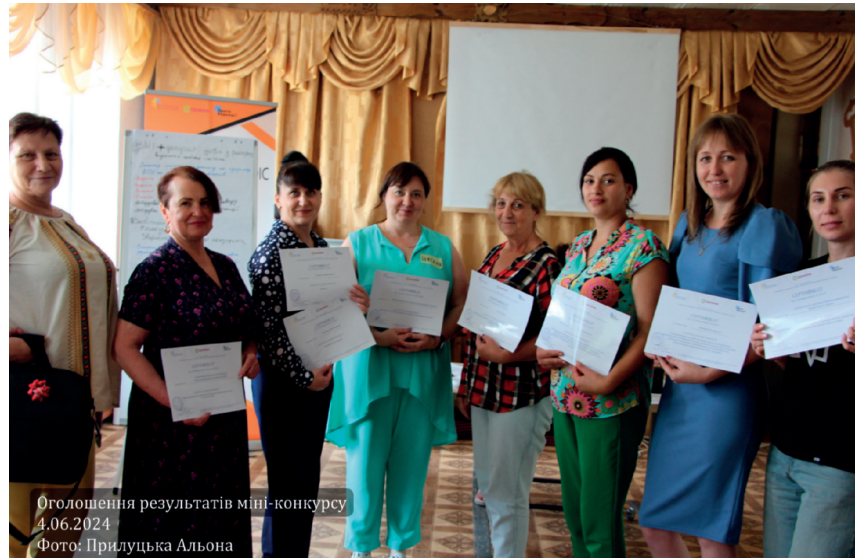
Оголошення результатів міні-конкурсу 4.06.2024

Вітаємо! Нехай це буде початком для нових звершень.