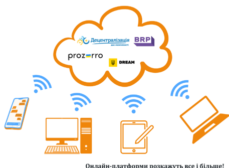
Онлайн-платформи розкажуть все і більше!

Соціологічне опитування, яке раніше провели представниці Громадського офісу відновлення ГО «Проти Корупції», показало, що громадськість зацікавлена у проінформованості про процеси відновлення, але не має необхідних інструментів для цього. Враховуючи інтерес до моніторингу відбудови, вирішили ознайомити мешканців громади з онлайн-ресурсами, які будуть корисними.